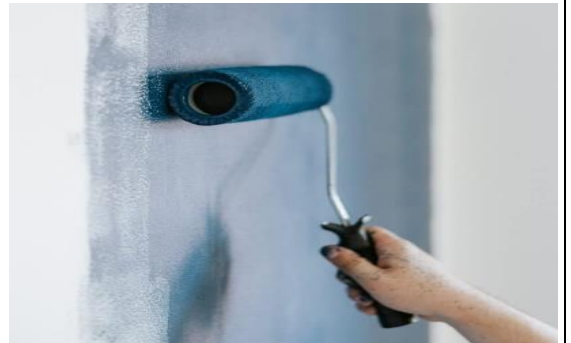
El pana miguel pintando nivel cinta negra