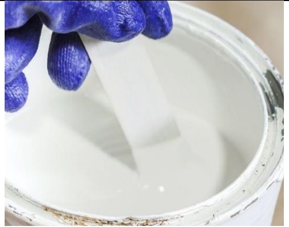
Hazlo como el pana miguel

https://www.youtube.com/watch?v=UbbGeuGKi0c