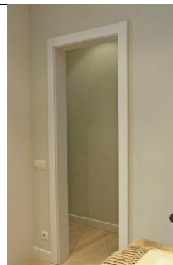
marco para puerta

Son elementos de transición entre la pared y la puerta, le dan relieve y la decoran. También entre la pared y la ventana.